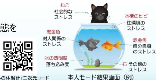
「こころの体温計」二次元コード

市ホームページから利用できます。自分自身のこころの健康状態を把握できる「本人モード」のほか、「ストレス対処タイプテスト」「認知症簡易チェック」など計8種類のチェックが可能です。毎月「こころの体温計の日」を決めて、従業員の参加を促してください。