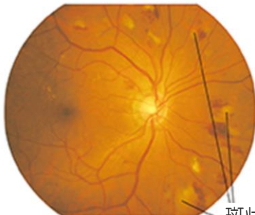
斑状出血・軟性白斑