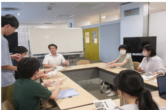
(世代を超えた熱い議論)

プロジェクトメンバーは20~60代の幅広い年代で、かつ学生から会社の経営者までといった本当に様々な方が参加しています。概ね2回のミーティングを終えて、チームごとのカラーが出てきました。 比較的事業者や企業関係者が多い「駅前運動会チーム」 はビジネスの視点から本格的な企画を練り上げています。 クリエイティブな方が多い「ストリートファニチャーチーム」 では、メンバーが特技を活かして事務局や専門家もビックリなアイデアが飛び出しています。