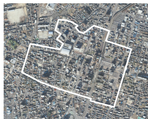
駐車場整備地区(小牧駅周辺)