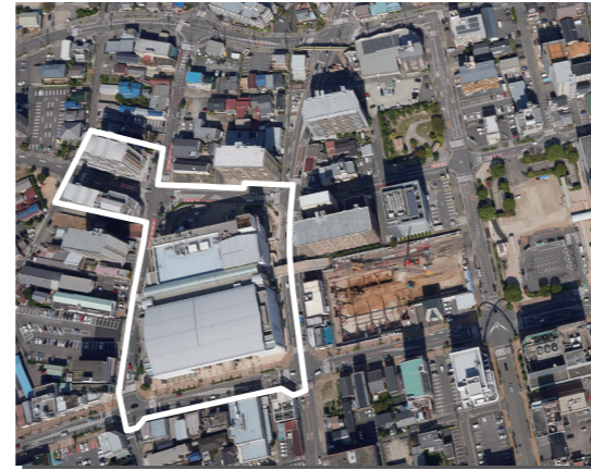
高度利用地区(小牧駅西側)