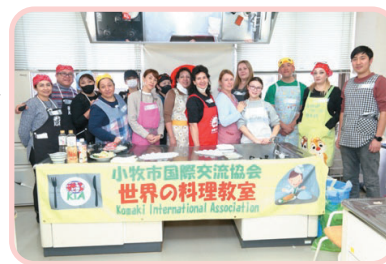
Imagen de las actividades anteriores

Precio Para miembros: 200 yenes; Para no miembros: 700 yenes.