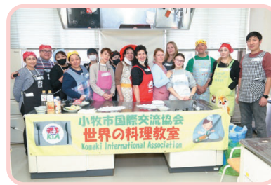
Imagem da atividade passada

※Mesmo que cancele depois de efetuada a inscrição não haverá a devolução do dinheiro