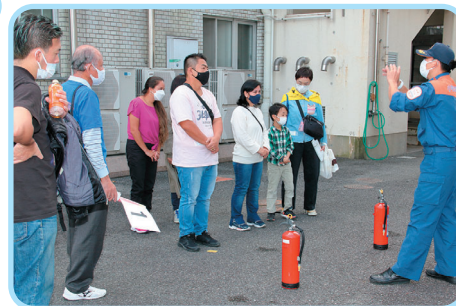
Imagem da atividade passada

Vamos aprimorar os nossos conhecimentos sobre prevenção de desastres (BOSAI)! Após o churrasco, vamos aprender como separar o lixo!