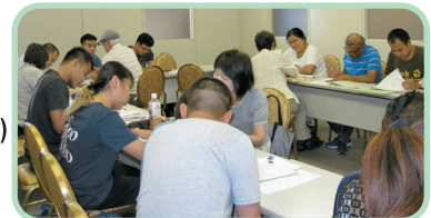
Ambiente do estudo

Data e horário 12/09 a 28/11 (aos domingos das 13h00 às 16h30) (Total de 12 aulas)