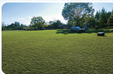
Local: 5786-1, Ōaza Ōkusa, Komaki-shi

Contato Shimin Shiki no Mori TEL.0568-78-4554