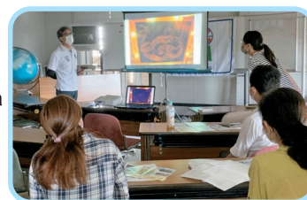
Atividade anterior realizada "Você é o repórter".