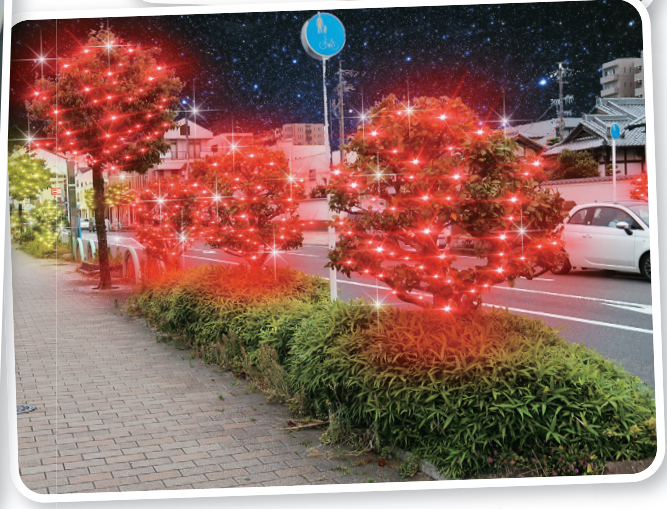
Decoração das luzes externas do Symbol Road e decoração das árvores das calçadas.

Contato Divisão para a Promoção Municipal TEL.0568-76-1173