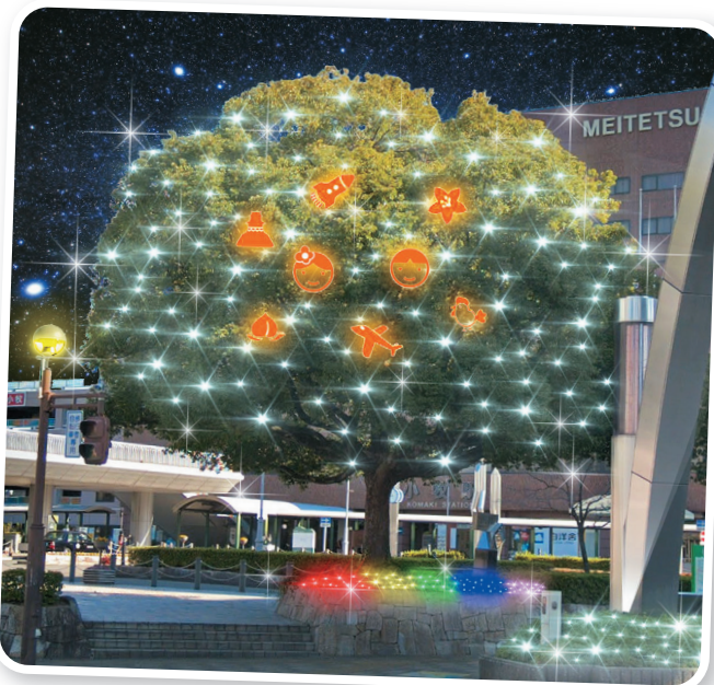
Árvore simbólica em frente à estação.

Local Ruas próximas à Estação de Komaki.