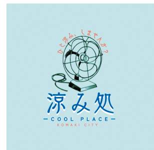
▲涼み処 (COOL PLACE) のロゴマーク

ここ数年、熱中症で多くの人が救急車で運ばれています。このような状況から少しの間、暑さを避ける場所として、小牧市内の公共施設のうち、市民の人が自由に出入りできる場所を「涼み処 (COOL PLACE)」として提供します (ロゴマークが目印です)。「涼み処 (COOL PLACE)」は暑いときに、ふらっと自由に入ることができる場所です。外が暑くて、涼しい場所に行きたいときはぜひ使ってください。