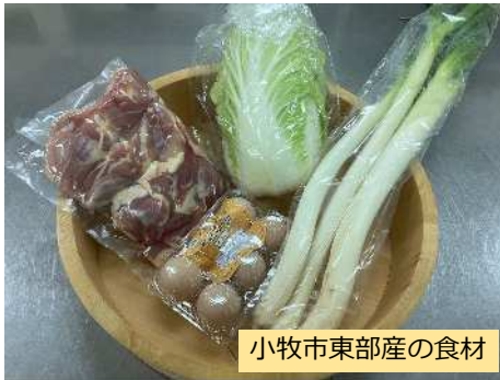
小牧市東部産の食材