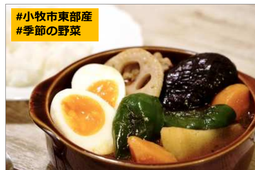
#小牧市東部産 #季節の野菜