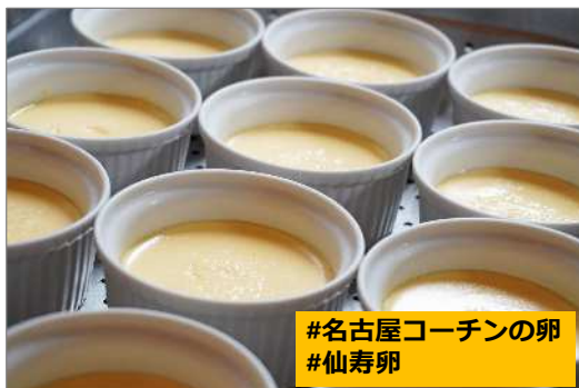
#名古屋コーチンの卵 #仙寿卵