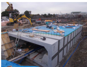
令和4年～令和5年度施工 河川水路整備事業 (小針川整備事業)