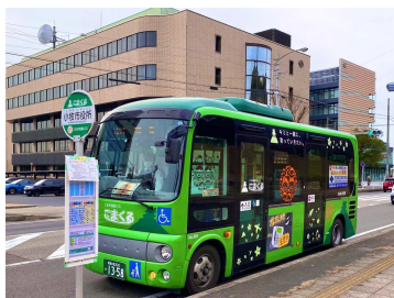
こまき巡回バス「こまくる」

まちづくりと連携した地域公共交通ネットワーク形成を促進するとともに、持続可能な公共交通を維持するため、利用者をはじめ市民の方々の声をお聴きするためのアンケート調査や地域懇談会などを実施し、地域公共交通計画の策定をはじめ、こまき巡回バス「こまくる」の再編の検討を進めます。