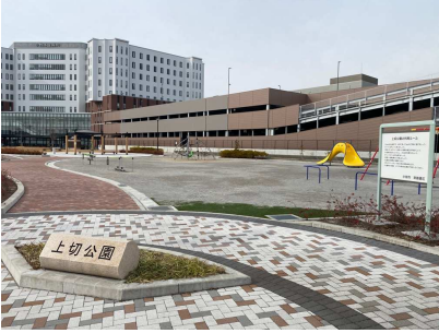
上切公園(令和3年度施工)

経年劣化が進む児童遊園を、安心して遊べる児童遊園とするため、計画的に施設再整備を行います。