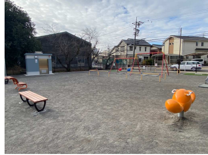
東田中児童遊園(令和4年度施工)