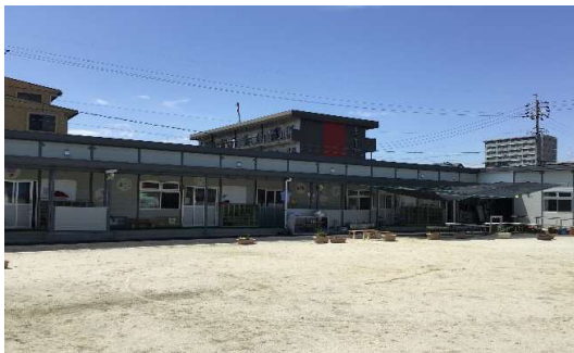
現在は仮園舎で過ごしています