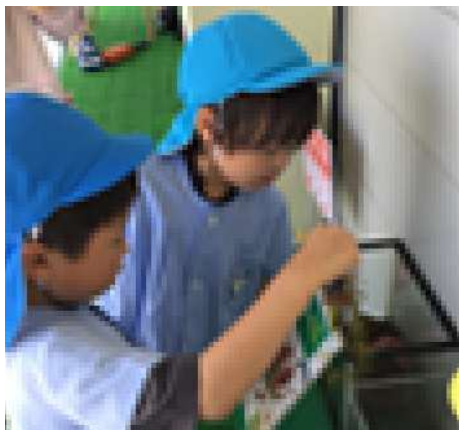
「すいそうのおみずをかえよう」ざりがにのおせわ