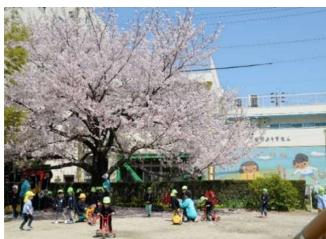
桜の下で遊ぶ子ども