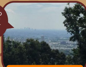
青空小屋からの眺め