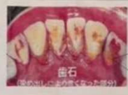
歯石 (詰め物の上の白く変った部分)

自分では、歯ブラシでは落とせない汚れを専用の機械で落としてもらってスッキリ!セルフケアをしやすいお口にしてもらう!