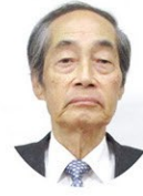
小牧市地区民生委員・児童委員連絡協議会