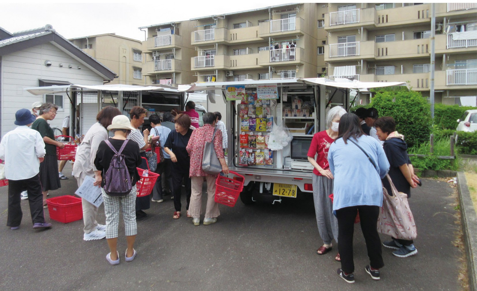
北外山県住中央集会所での移動販売の様子

昨年一年を振り返りますと、地球温暖化の影響か、猛暑、竜巻等の自然の力に翻弄されました。