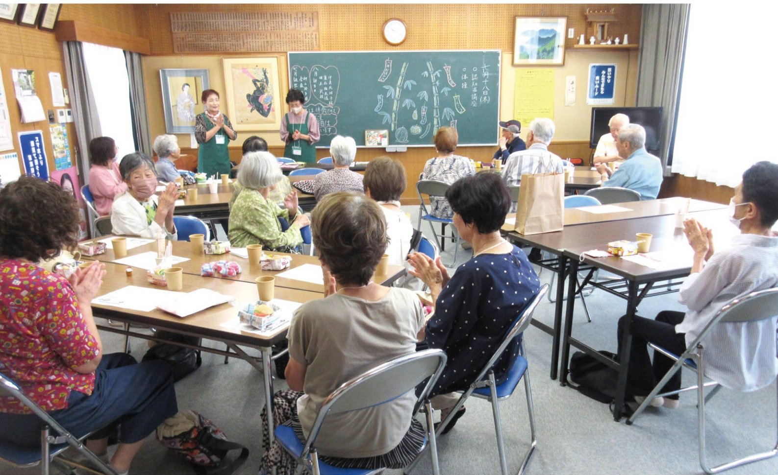
「みどり台集いの会(サロン)の様子」

昨年一年を振り返りますと、日本各地で大きな地震や豪雨があり、多くの人命や財産等が失われました。