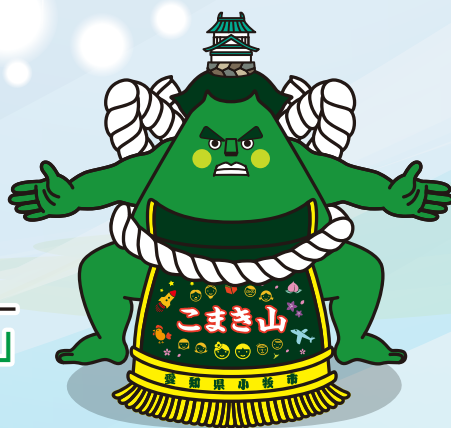
小牧市マスコットキャラクター 「こまき山」