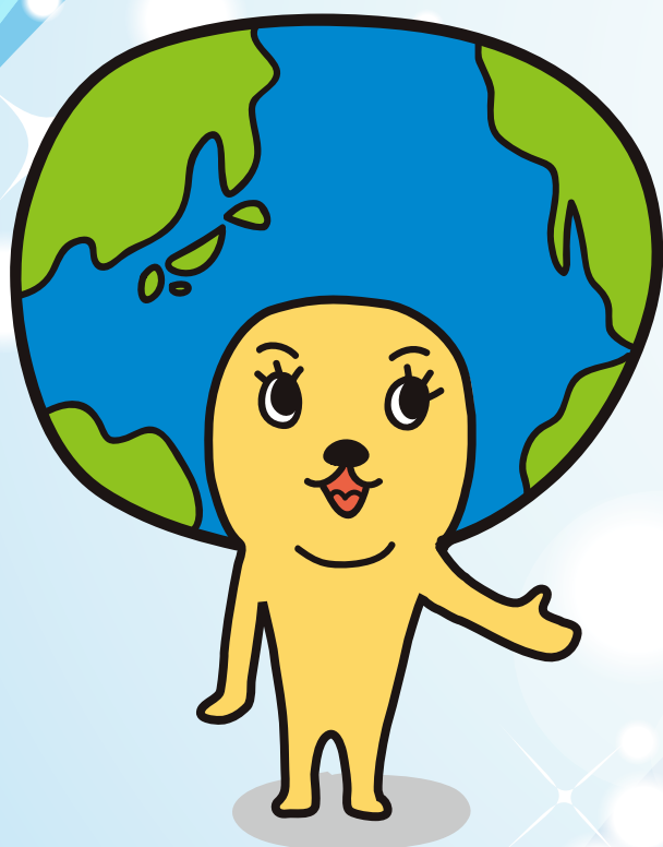
小牧市環境キャラクター「エコリン」