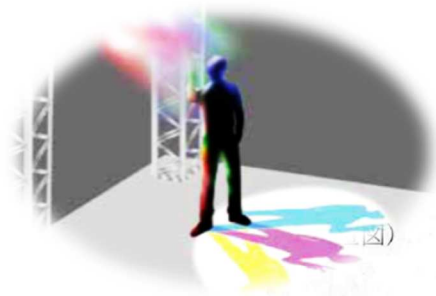
図書館前エリア装飾