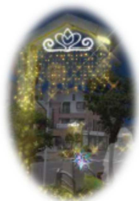
シンボルロード装飾