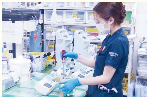
▲医療機器保守点検

生命維持管理装置には人工呼吸器や人工心肺装置、植え込み型心臓デバイス、補助循環装置、血液浄化装置、除細動器、保育器等さまざまあります。その他、薬液注入ポンプや生体情報モニターなどさまざまな医療機器が多数あり、これらをつつでも安全に使用出来るように、保守点検、集中管理を行い医療機器の安全を日々守っています。