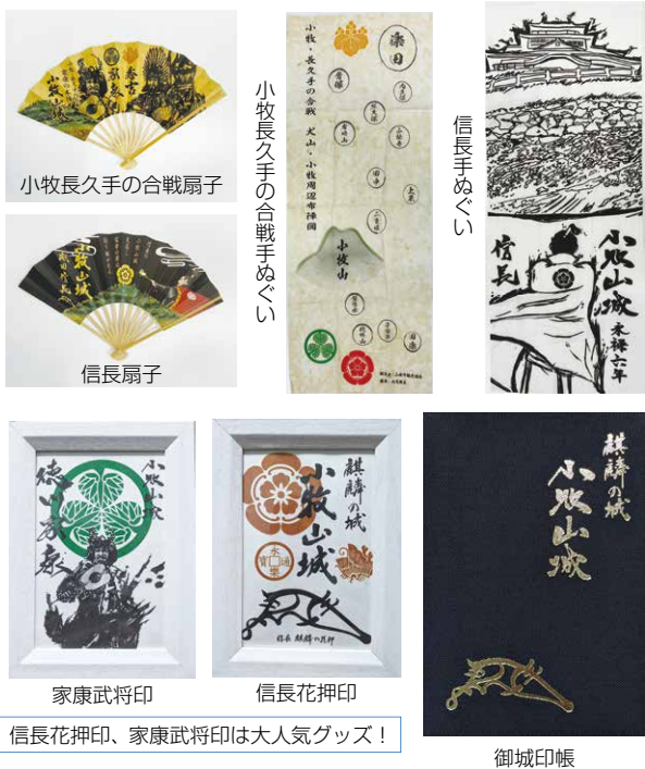
小牧長久手の合戦扇子