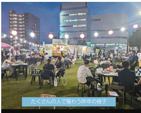
たくさんの人で賑わう昨年の様子

市民レポーターの皆さんが、市内のさまざまな場所に出かけて、市民ならではの視点から小牧の魅力や身近な話題について取材した様子を、毎月紹介していくコーナーです!