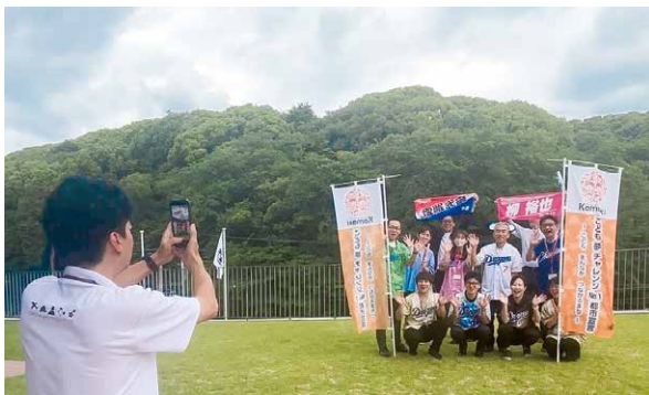
(応援動画の募集を呼びかけるドラゴンズ歓迎隊)

市は、中日ドラゴンズのファーム拠点、いわゆる2軍本拠地の誘致に名乗りを上げました。誘致の実現に向けて、市ではプロジェクトチームに加え、若手職員を中心とした機運醸成チーム「ドラゴンズ歓迎隊」を発足。市役所全体で、本格的に取組を進めています。また、6月には市民・企業等の皆さんから応援動画を募集する企画を行い、「ぜひ小牧に来てください！」「ドラゴンズ、来てほしい！」など、多くの方から熱いメッセージを寄せていただきました。少しずつ、まちの想いが形になり始めています。本当にありがとうございました。