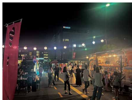
小牧市にぎわい広場に並ぶキッチンカー

イベント担当者からは「会場は駅前の広場ですので、ルールを守って楽しく利用してください。屋外ですが市の指定する禁煙区域であることをご理解ください」と、呼び掛けています。