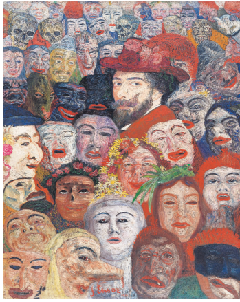
ジェームズ・アンソール 《仮面の中の自画像》