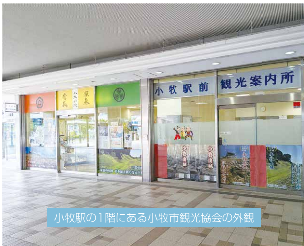
小牧駅の1階にある小牧市観光協会の外観