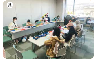
①②防災訓練、③④地域まつり、⑤⑥おたすけ活動、⑦さつまいも掘り、⑧折り紙教室