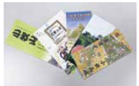
観光協会にあるパンフレットの一部分。活用してね。

QRコードを読み込むと、小牧山城の中の自分の場所と信長、家康時代の小牧山城復元構想図がコラボして、今いる場所が当時こんな風だった!と楽しめます。マップには家康コースと信長コースがあり、小牧山城 天下とり隊と記念写真ができるフォト機能などもあります。