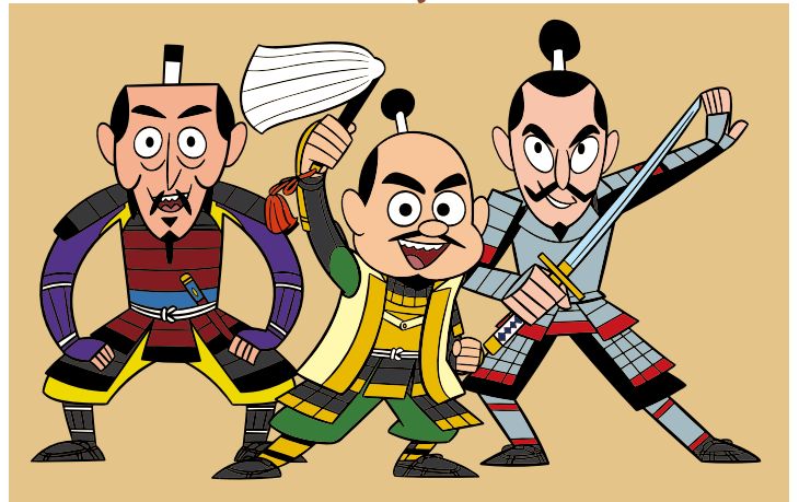
小牧山城 天下とり隊