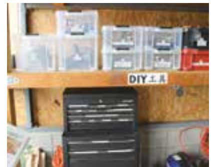
かなりの数の工具が使えます。

お家にちよっと手を加えて、生活の質を上げたい、きつと誰もが思うはず。ここに棚があれば、自分で修理できれば、と思っても、いざ始めるとなると道具がない、スペースがないと壁が立ち上がり、そんな壁を取っ払う強い味方を紹介します。 市内で造園業を営む愛光園。造園業のほかに、絵画教室や養蜂と地域に根差した事業を展開しています。 今回、新しくDIYのサブスクを始めようと思ったきっかけについて尋ねたところ、家庭用からプロ仕様まで幅広く取りそろえた数々の質の良い工具は、どれも丁寧に使い、入念にメンテナンスをしてきましたが、仕事の内容によっても季節によっても使用する工具は異なり、多くの工具が倉庫の中で出番を待っています。ストックされたまま、出番を待ち続けるだけではもったいない。何かが有効活用する方法はな