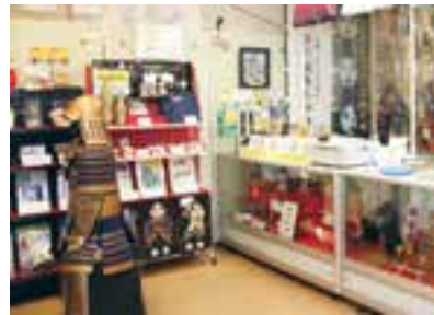
観光協会の中。見るだけでも楽しいです!

史に名を刻む織田信長、豊臣秀吉、徳川家康の三英傑が出揃う城として遠方から多くの観光客が訪れています。また、NHK 大河ドラマ「どうする家康」で家康ブームとなり小牧山城も注目が集まりそんな予感が大です。そんな中、観光協会は、4月に新しくなった小牧山歴史館に土産店をオープン。今まで御城印などお城が好きな人をターゲットにした土産が多かったのですが、昨秋に新キ