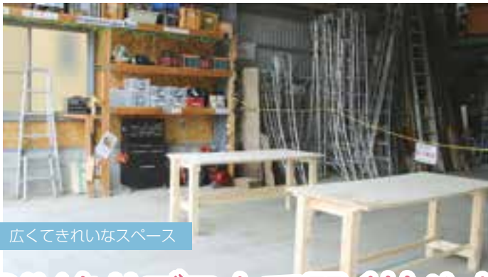
広くてきれいなスペース

市民レポーターの皆さんが、市内のさまざまな場所に出かけて、市民ならではの視点から小牧の魅力や身近な話題について取材した様子を、毎月紹介していくコーナーです!