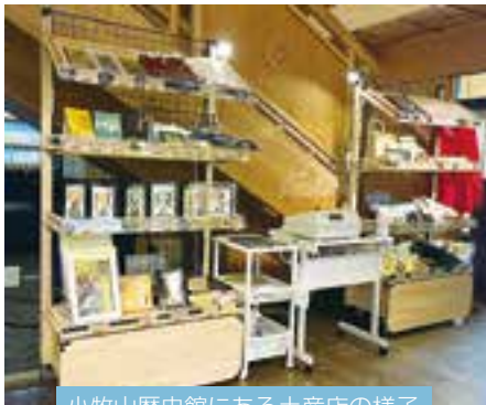
小牧山歴史館にある土産店の様子