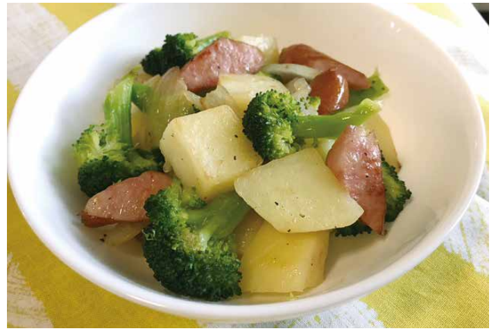
※学校給食用にアレンジしました。