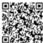
◀接種券の発送状況

4月24日から、年齢の高い方から順に発送しています。発送状況はホームページをご覧ください。