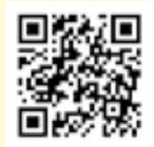
▲接種券発行申込み専用フォーム