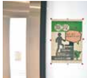
(階段利用促進の掲示)