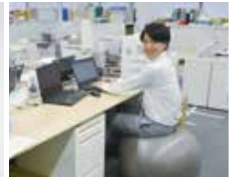
(バランスボールの試験導入)