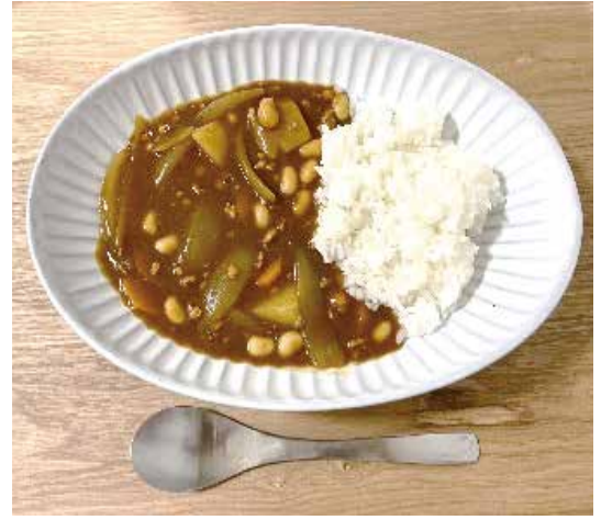
※学校給食用にアレンジしました。