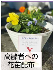
高齢者への 花苗配布