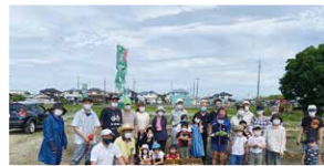
ふれあい農園&収穫祭