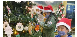
クリスマスツリー設置