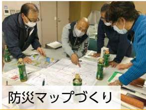
防災マップづくり