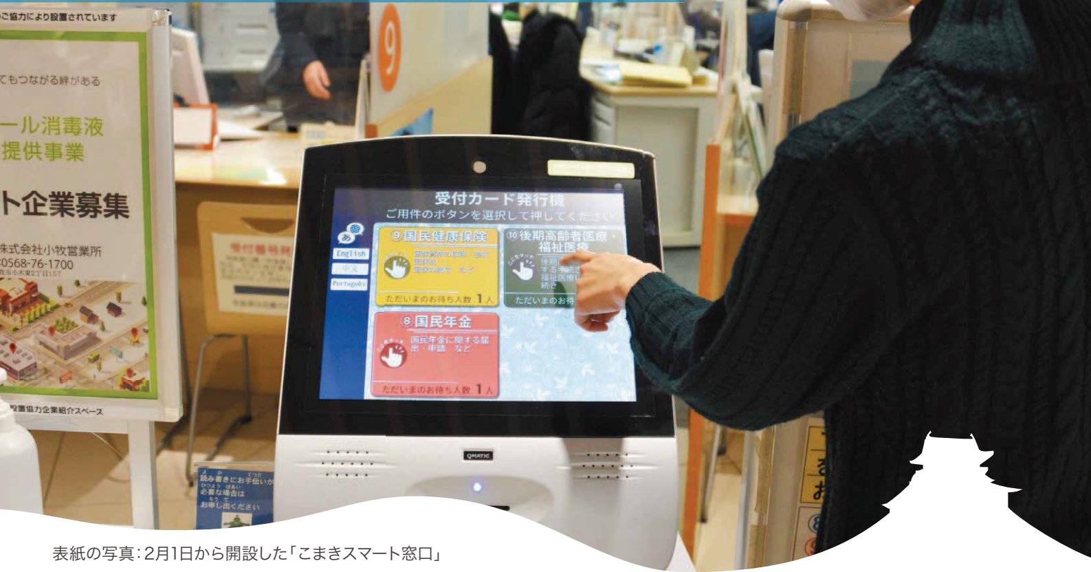
表紙の写真: 2月1日から開設した「こまきスマート窓口」