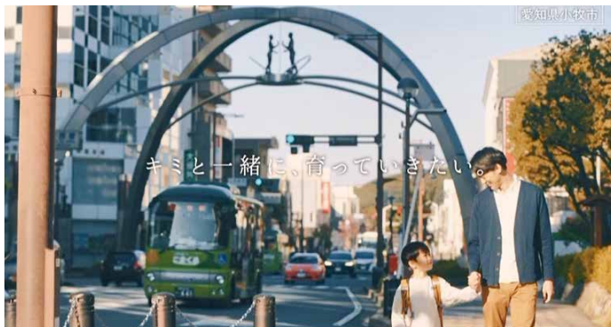
▲新ブランドムービー「私が育ったまち編」 女の子編（左図）・男の子編（右図）

「私が育ったまち編」は、小牧市で育ったお父さん・お母さんが主人公です。自分のこどものころを思い出しながら、さらに進化している小牧市のまちに想いを馳せており、こどもの夢を応援する取り組みが充実しているまちだからこそ、このまちでよかった、このまちで子育てしたいという想いを伝えるストーリーになっています。