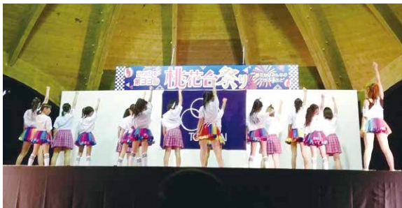
桃花台まつりで披露したステージ

小学2年生でダンスを始めた香音さん。中学生で学業のためダンスから離れる時期もありましたが、