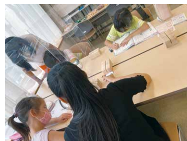
子どもたちに勉強を教えています。