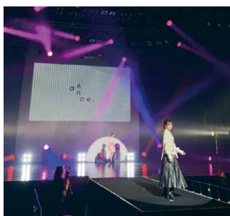
CAMPUS COLLECTION NAGOYA2021に出演した時の様子

2つ目は、カフェで、ダイエット弁当を手作りして学生に販売すること。中学1年生の時、香音さんは芸能界に入り、周りの影響でインターネットサイトに書いてあったダイエット法に挑戦し、体