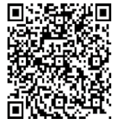
▲ Web 申込ページ

こまき市民文化財団 こまなびサロン (〒485 - 0041 小牧 2 - 107 ☎77 - 8269)