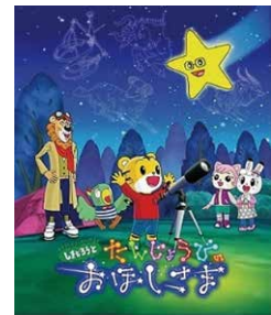
しまじろう

申込み 開催当日の午前10時から中部公民館1階受付窓口で入場券発売、座席整理券配布。