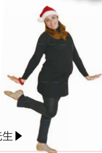
ご参加お待ちしております♪