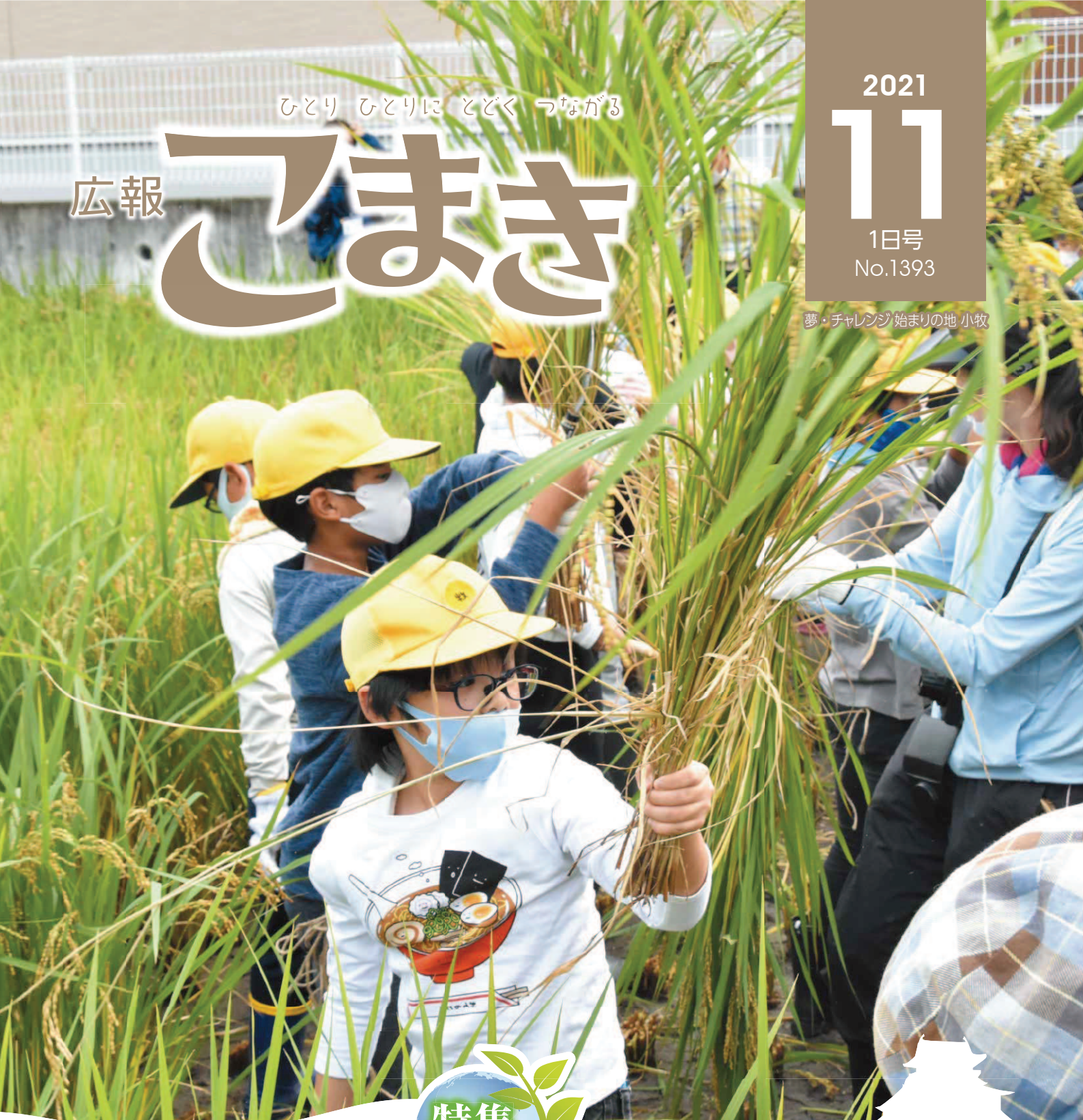
表紙の写真:三ツ淵小学校稲刈り(10/7)