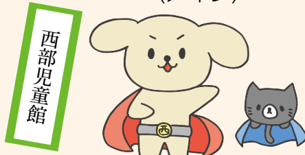
『にし丸&ぷにぷに』 (メイン)