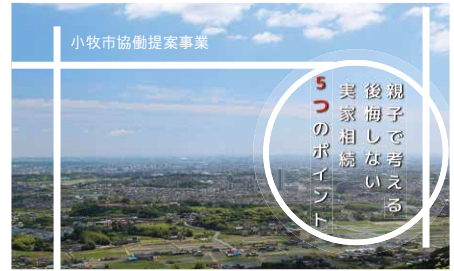
地域で考える空家をつくらないセミナーのご案内