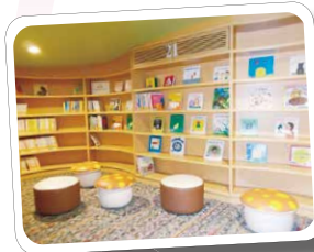
▼中央図書館児童エリア

開館時間：午前9時30分～午後5時30分 休館日：毎月第3火曜日およびその前日の月曜日（月曜日が祝日の場合はその翌々日の水曜日）、年末年始 場所：ラピオ4階 問合せ先：えほん図書館（☎41・4646）