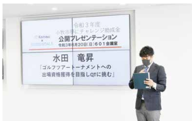
前回の公開プレゼンテーションの様子