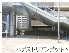
ペDESTリアンデッキ下