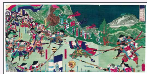
▲『小牧山猿吉郎春永公に仕る図』一魁齋芳年/画

こまき・デジタルコレクションは、「象山文庫」ほか図書館が収集する郷土資料から貴重価値の高い362点をデジタル化し、ログインなしでどなたでもご覧いただけるコレクションです。 セピア色の絵葉書の気になる部分を拡大してじっくり眺めてみれば、懐かしい小牧、古き良き尾張愛知の姿が浮かんできます。「信長文庫」より、一魁齋芳年の錦絵『小牧山猿吉郎春永公に仕る図』など、珍しい資料も公開中です。この機会にぜひ活用ください。