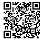
▲スポーツ協会ホームページ

とき 10月3日(日)～毎週日曜日 ※一般女子・実年の部は10月31日～ ところ 村中運動場 対象 市内在住・在勤・在学の方で構成されたチームまたは市ソフトボール協会加盟チーム ※実年の部は55歳以上（10月1日現在の満年齢） 申込期限 8月22日(日) 監督者会議 9月12日(日)午後7時～パークアリーナ小牧会議室A ※参加されないチームは棄権とみなします。