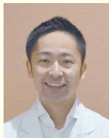
糖尿病・内分泌内科部長医師