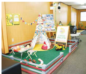
パパやママがキャンピングカーを見ている間や話している間は、事務所に設置されたキッズスペースがあるから安心です。

つと手を加えるとベッドに早変わり! なんて、子どもには絶好のスペースです。「プライベート空間で、優雅な感覚を味わえるけれど、キャンピングカーは動くホテルや家ではありません。やはり不便があります。そういった不便も工夫して楽しんでもらえるといいですね」