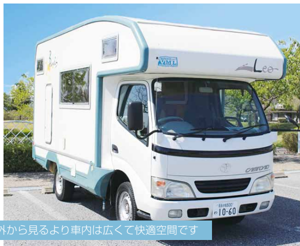
外から見るより車内は広くて快適空間です