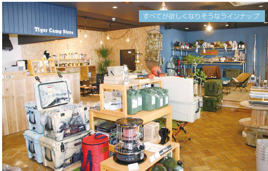
すべてが欲しくなりそうなラインナップ

キャンプが好き。年間50回余りキャンプに出掛ける熟練キャンパーというオーナー夫妻。 「これはいい！」と思ったグッズが中々ない、手に入らない、だったら「自分で店を作ればいいんだ!」と、キャンプ好きが高じて、小牧に店を開きました。 「良い物を紹介したい」と