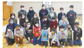
参加した親子全員で記念撮影！

ブース出展にあたり、交流部会は、新型コロナ禍で様々な制約がかかる中、参加者同士が3密にならないプログラムや、当日の感染症対策などを検討。当日は、事前に参加申し込みした10組の親子が低学年・高学年に分かれ、No.1 親子を目指して競い合いました。