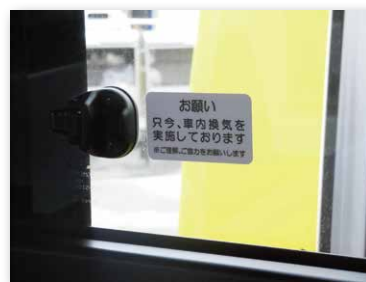
車内換気実施のお願い (名鉄バス)