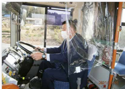
運転席にビニールカーテンを設置 (ピーチバス)