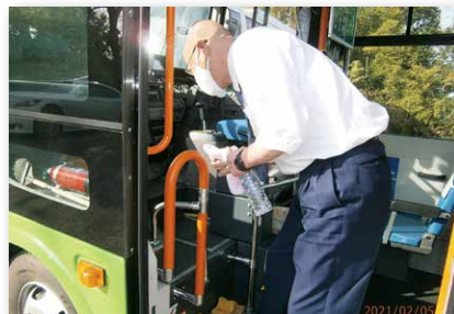
車両消毒の様子 (こまくる)