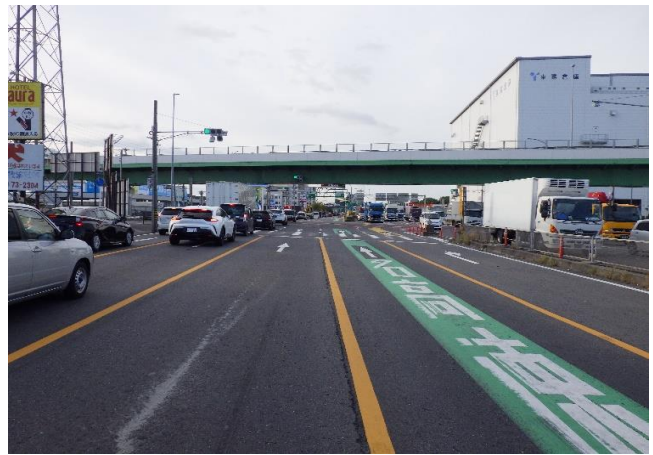
交通事故現場の状況 (乗用車の進行方向から撮影したもの)