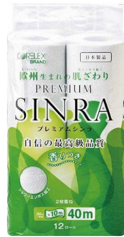
収集した雑がみによって作られたトイレトペーパー