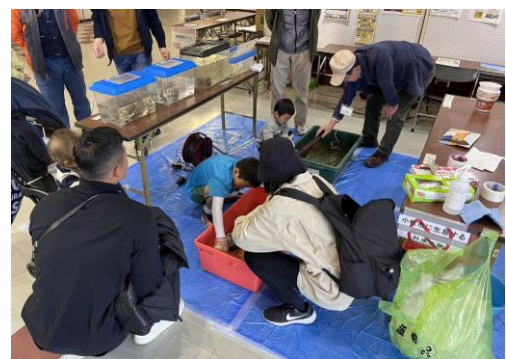
環境フェアより生きものの観察の様子