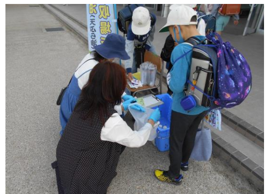
廃食用油の回収の様子