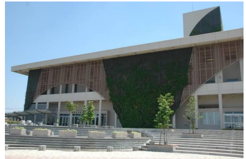
市民会館・市公民館