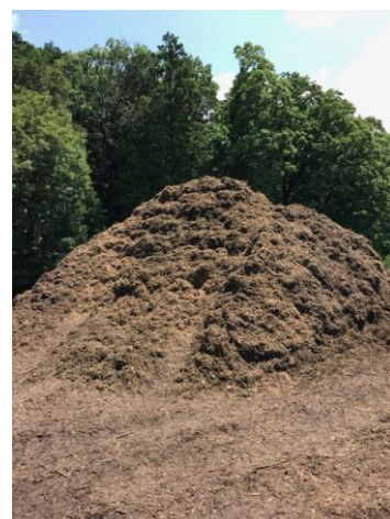
破砕された剪定枝類