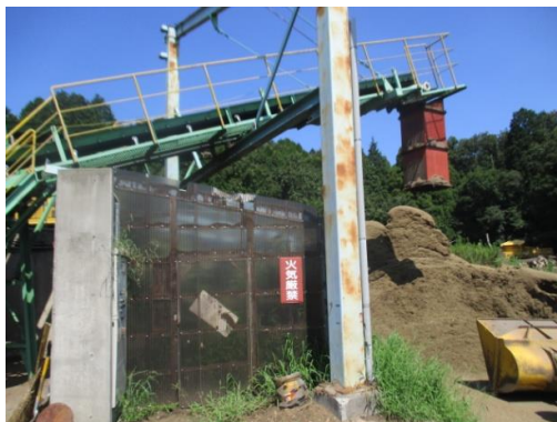
剪定枝類を破砕する様子