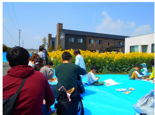
菜の花フェスティバルの様子