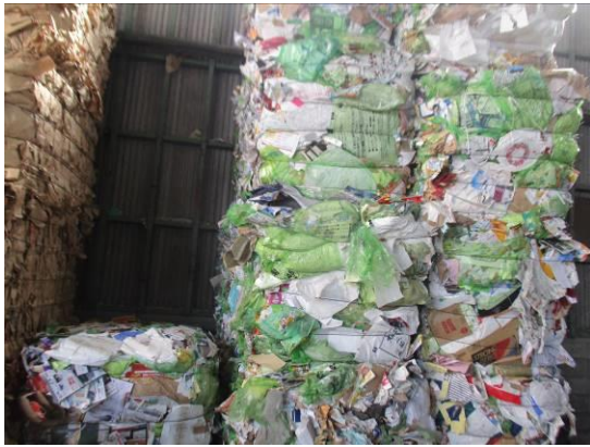
圧縮梱包された雑がみ