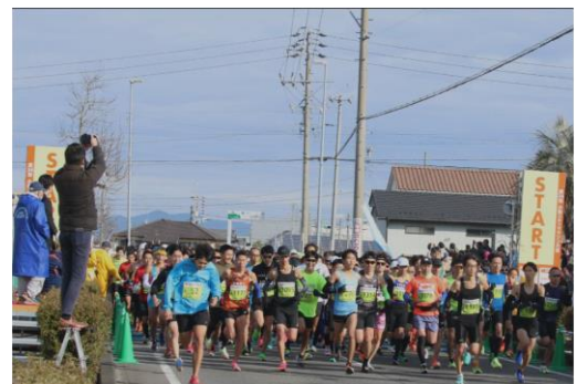
スポーツ大会開催委託事業の様子