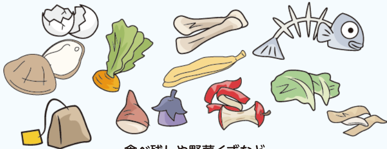
食べ残しや野菜くずなど