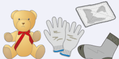
綿製品や資源にならない布類など