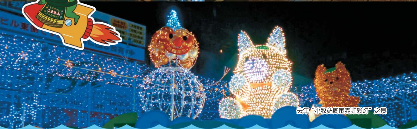
去年“小牧站周围霓虹彩灯”之景