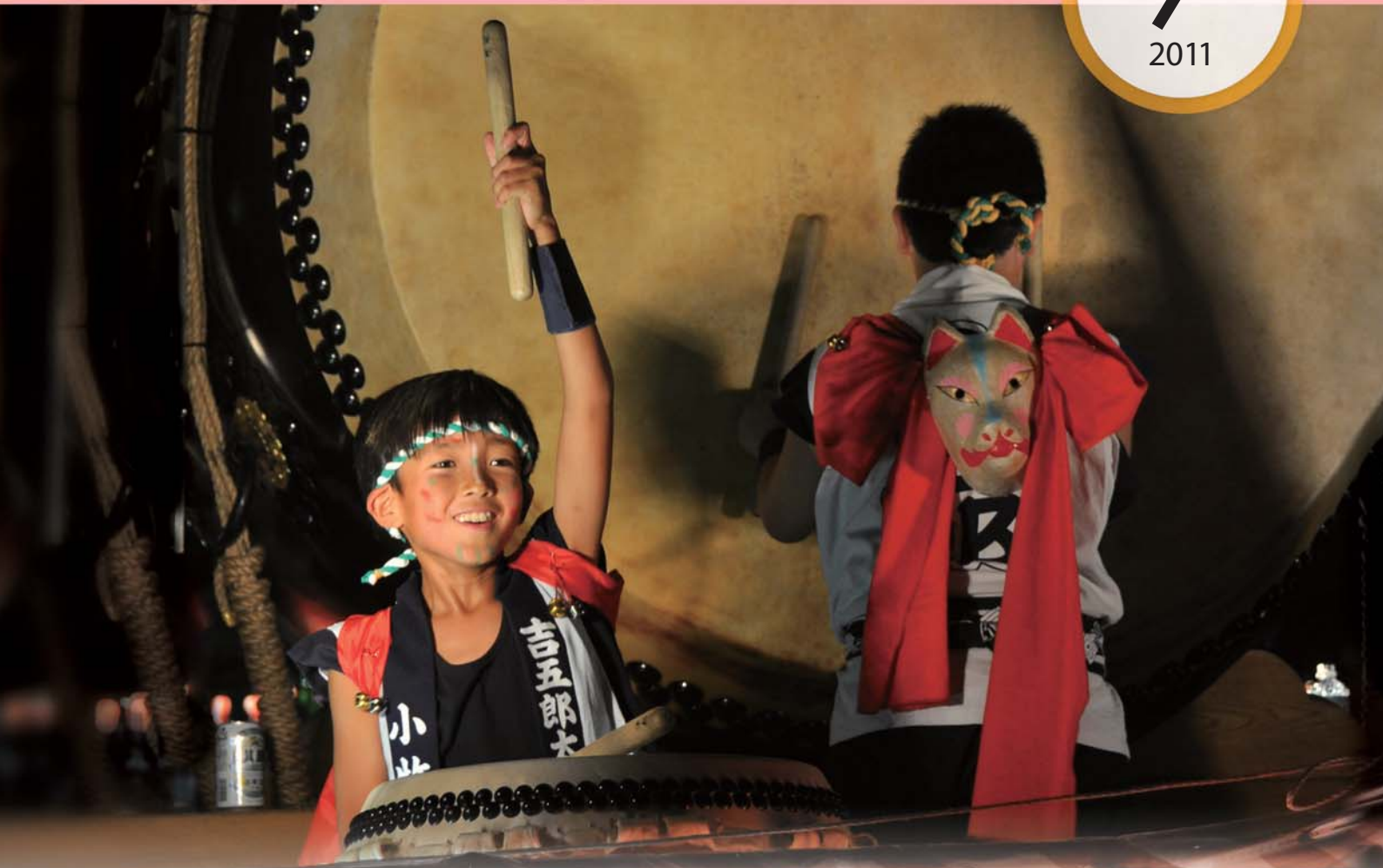
小牧平成夏祭(去年)