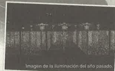
Imagen de la iluminación del año pasado.

Informaciones División de Asuntos sobre la vida de la Municipalidad de Komaki TEL 0568-76-1173