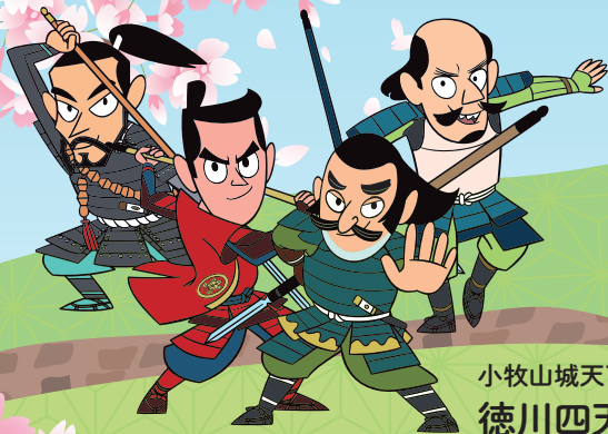
小牧山城天下とり隊 徳川四天王