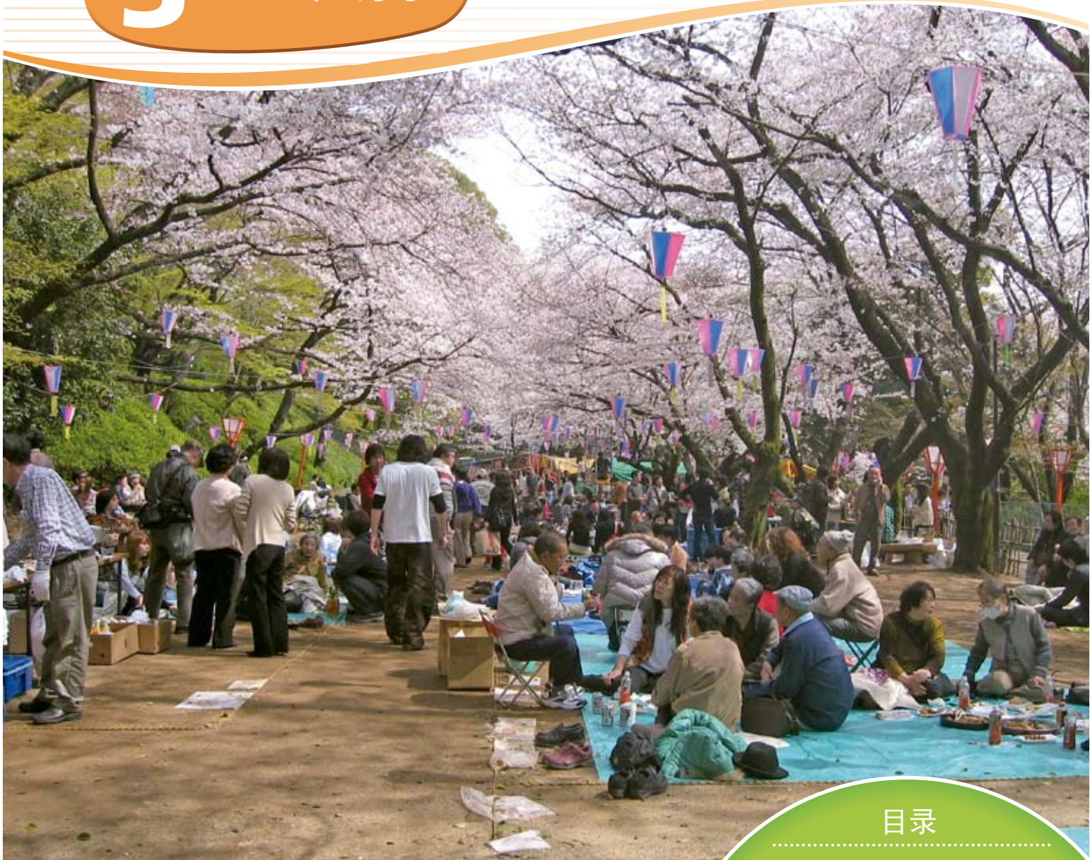
小牧山樱花节 (详细内容请见第2页)