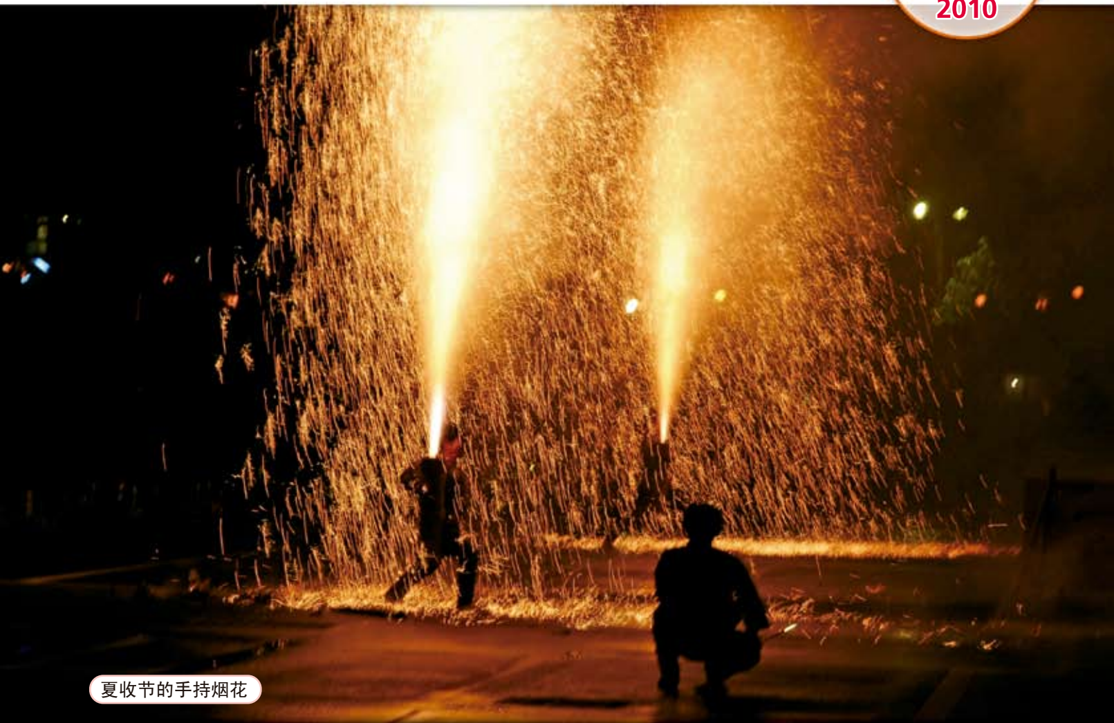
夏收节的手持烟花