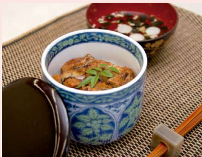
提供：学校给食营养部会